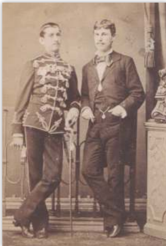
3. Гардијски поручник с пријатељем, Београд, 1881. 3. Guards lieutenant with a friend, Belgrade, 1881.

„Велико одрицање” мушкараца од естетизације свог тела разнобојношћу и атрактивним украсима тумачено је као симболичка комуникација нових мушких врлина штедљивости, марљивости и практичности, док се некадашње „пауново перје” мушкараца одбацивало као знак идеологије Ancien Regime -а. Украшавањем и колорит у одевању с временом су почели да функционисају као знаци женствености (Липовецки 1992: 67). Међутим, монолитну слику о тамном и једноставном мушком оделу дестабилизује војна парадна униформа тог времена (сл. 3). Униформа је, по свом колориту и скупocenим украсима, била ближа женском одевању, због чега су и униформа и женско одевање привлачили погледе, а интернализовањем погледа и војник и жена су сводили себе на објекат или слику према друштвеним мерилима (Matthews David 2003: 7). Без обзира на елементе који су сматрани ознакама женствености, и