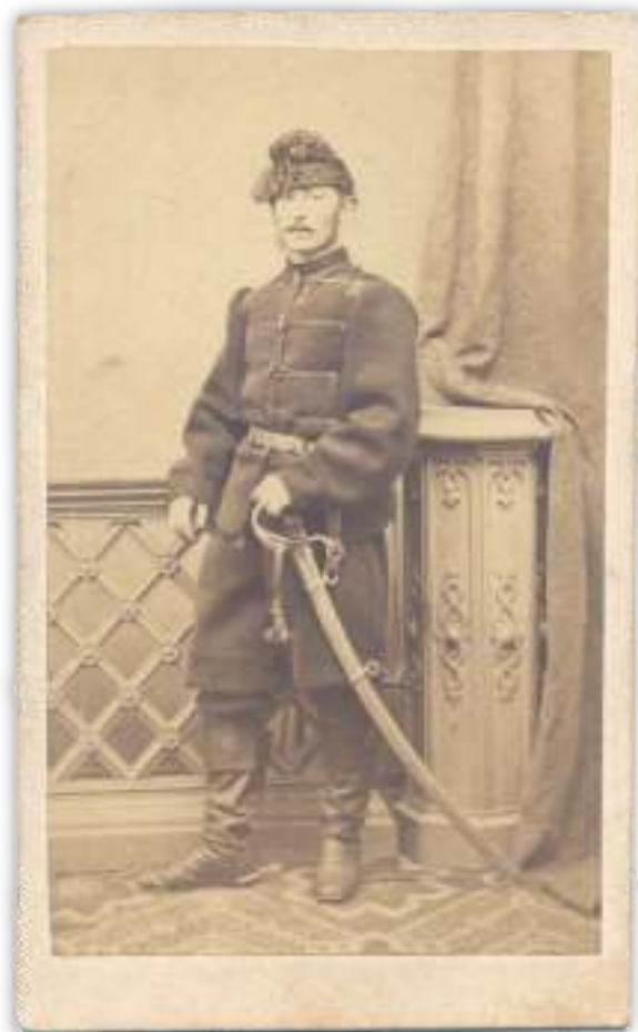
2. Коњаник народне војске у униформи из 1864. године. 2. People's Army cavalryman in uniform dated from 1864.

Поред гардијске униформе, нарочито је одело намењено униформисању народне војске било обликовано у складу с представама о националним обележјима ношње за разлику од стајаће војске, која је била униформисана у складу с европским трендовима. Године 1864, народна војска добија „народно одело” које се својим кројем, попречним гајтанима и калпаком, умногоме ослањало на већ поменуте представе о „старом српском оделу” (сл. 2). Међутим, неколико година касније, нови начини ратовања су условили да се додељивање