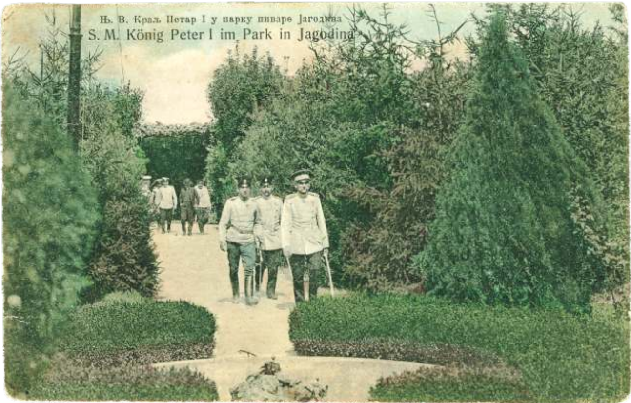
2. Н. В. Краљ Петар I у парку пиваре у Јагодини, 1907, Завичајни музеј Јагодина, инв. бр. 09-187 2. His Majesty the King Petar I in the Park of Jagodina Brewery, 1907, Regional Museum of Jagodina, inv. no. 09-187