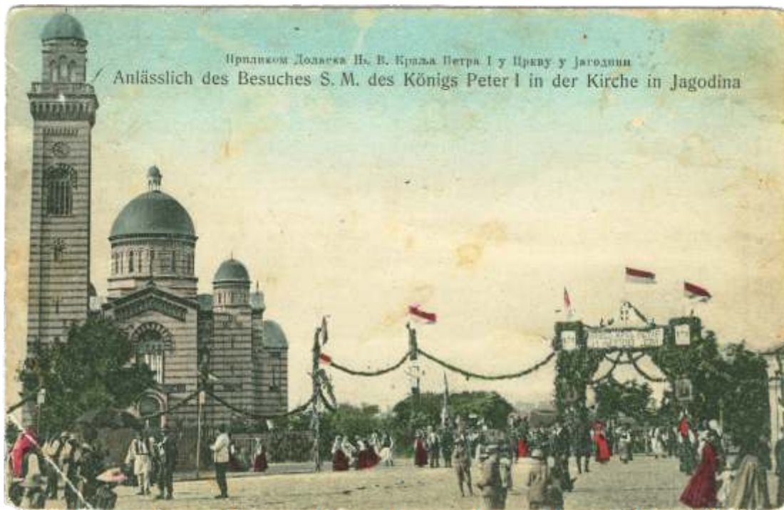
1. Долазак Њ. В. краља Петра I у цркву у Јагодини, 1907, Завичајни музеј Јагодина, инв. бр. 09-109 1. The Arrival of His Majesty the King Petar I to Church in Jagodina, 1907, Regional Museum of Jagodina, inv. no. 09-109