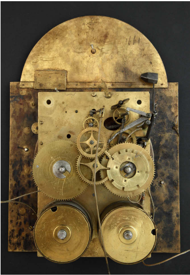
7. Mehanizam kojem je uklonjena stražnja platina 7. Movement with removed back plate

kvadratnih ploča koje je trebalo prilagoditi novoj modi, međutim, ubrzo se čitava ploča radi u jednom komadu. U taj novi polukružni prostor umeće se kružna pločica s imenom urara i mjestom gdje je sat izrađen.