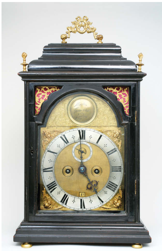
1. Tabernakl sat, inv. br. MUO 13365 1. Bracket clock, Museum of Arts and Crafts, Zagreb, Inv. No. 13365

1656. godine Nizozemac Christian Huygens 3 (The International Dictionary of Clocks 1996: 291) izradio je nacrt za prvi satni mehanizam s njihovom kao oscilatorom.